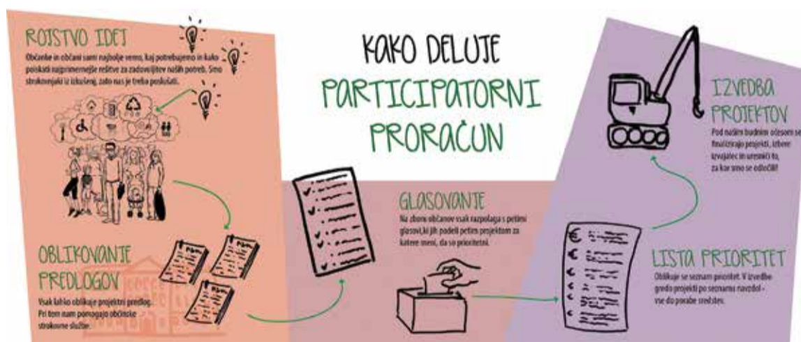
Prikaz načina delovanja participatornega proračuna

Tudi Novo mesto pozna nekaj takih primerov. Ne gre samo za vrtičkarje, ki so verjetno najbolj tradicionalna oblika urejanja prostora »od spodaj«. Angažirani posamezniki so uredili prostor ob Krki, imenovan Pumpnca. Nekoč zanemarjeno območje je postalo kopalnišče, piknik prostor, kulturno okolje, knjižnica in bar na prostem. Tudi Čitalniško ulico, kjer domuje