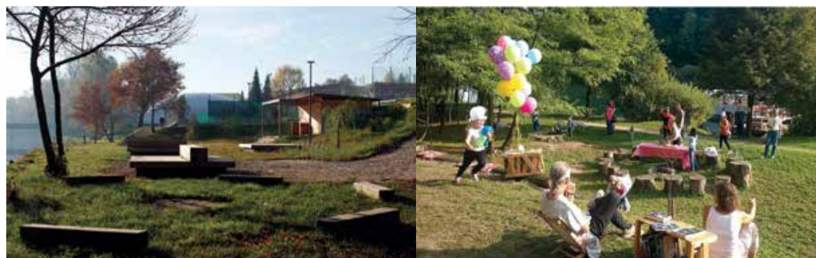
Občina je že v prejšnjem mandatu porabila okrog 180.000 evrov za »kopalnišče« na Loki, ki pa je na koncu postalo samo osamljen »prostor za piknike«. Na drugi strani Krke imamo prostor druženja, v katerega občina ni vložila nič, ampak so ga s prostovoljnimi delom uredili ljudje sami.

Občani imajo mnogo dobrih idej. Vendar se v obstoječem sistemu njihove pobude izgubijo, še preden pridejo skozi birokratsko sito do vrat tistih, ki odločajo. Participatorni proračun, skupnostne prakse ter lokalna pisarna celovite prenovne so načini, kako se bodo pobude občanov lahko tudi uresničile.