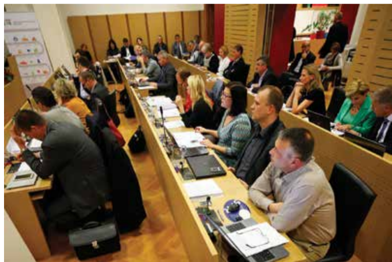
Utrinek z 10. seje občinskega sveta

Solidarnost podprla večino sklepov na 10. seji občinskega sveta